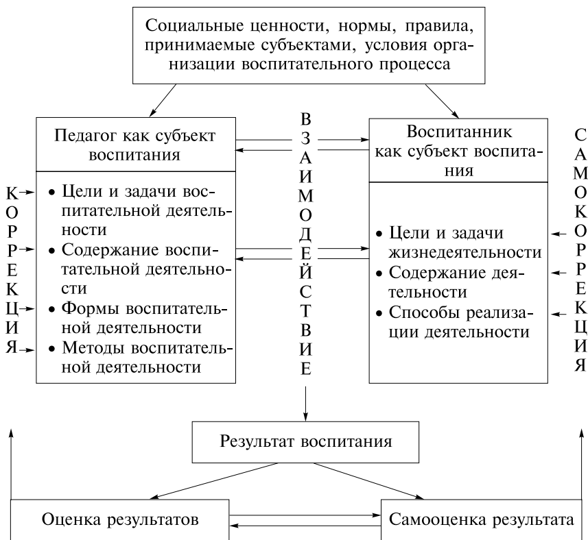
Рис. 2. Структура процесса воспитания

положительный результат процесса воспитания. Таким образом, воспитательный процесс представляет собой объединение действий и мнений автономных субъектов (воспитателей, детей, коллективов, социальных групп и др.), структурная целостность которых может быть представлена в общем виде (рис. 2).